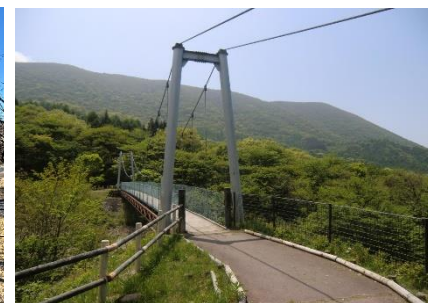
さくらの広場 ふれあい橋

路面凍結の為、こちら側(正門)から入園することはできません！さくらの広場のふれあい橋から徒歩で入園してください。