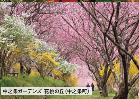
中之条ガーデンズ 花桃の丘(中之条町)