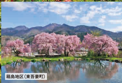
箱島地区(東吾妻町)