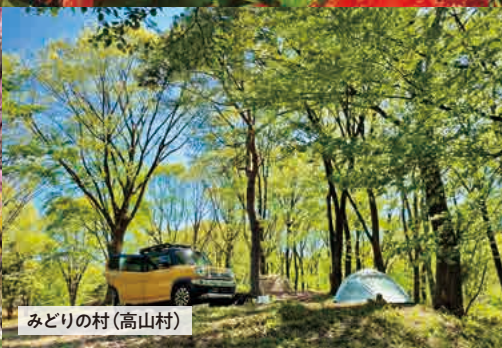
みどりの村(高山村)