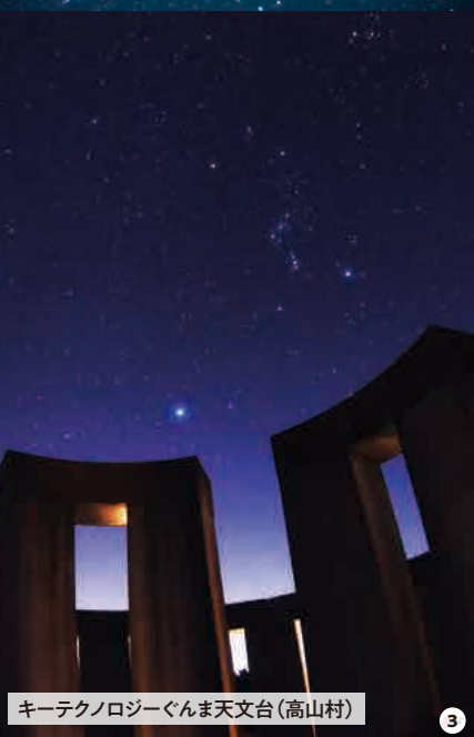
キーテクノロジーぐま天文台(高山村)

あがつまの夜は、きれいな夜空が広がります。澄んだきれいな空気に加え高原や開けた谷の地形なので、ほとんどの場所で美しい夜空が望めます。