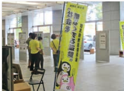
県庁県民ホールで7月に行われたパネル展の様子

群馬県では7月の再犯防止啓発月間にあわせ、広報啓発活動を実施したり、内閣総理大臣メッセージ伝達式において、パネル展示や資料配布等を行ったりしています。