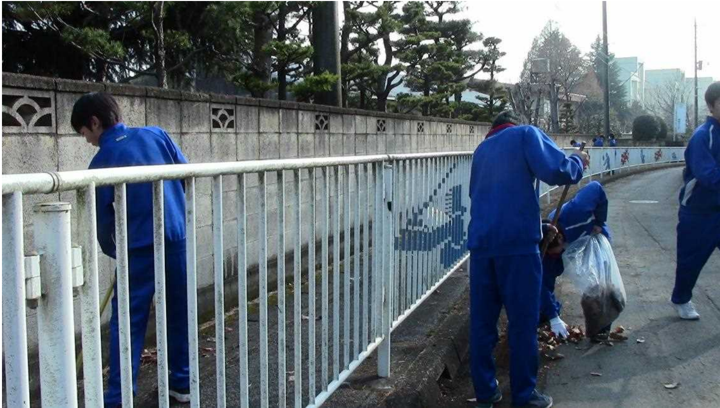
多々良中周辺の公園や公民館などの清掃作業