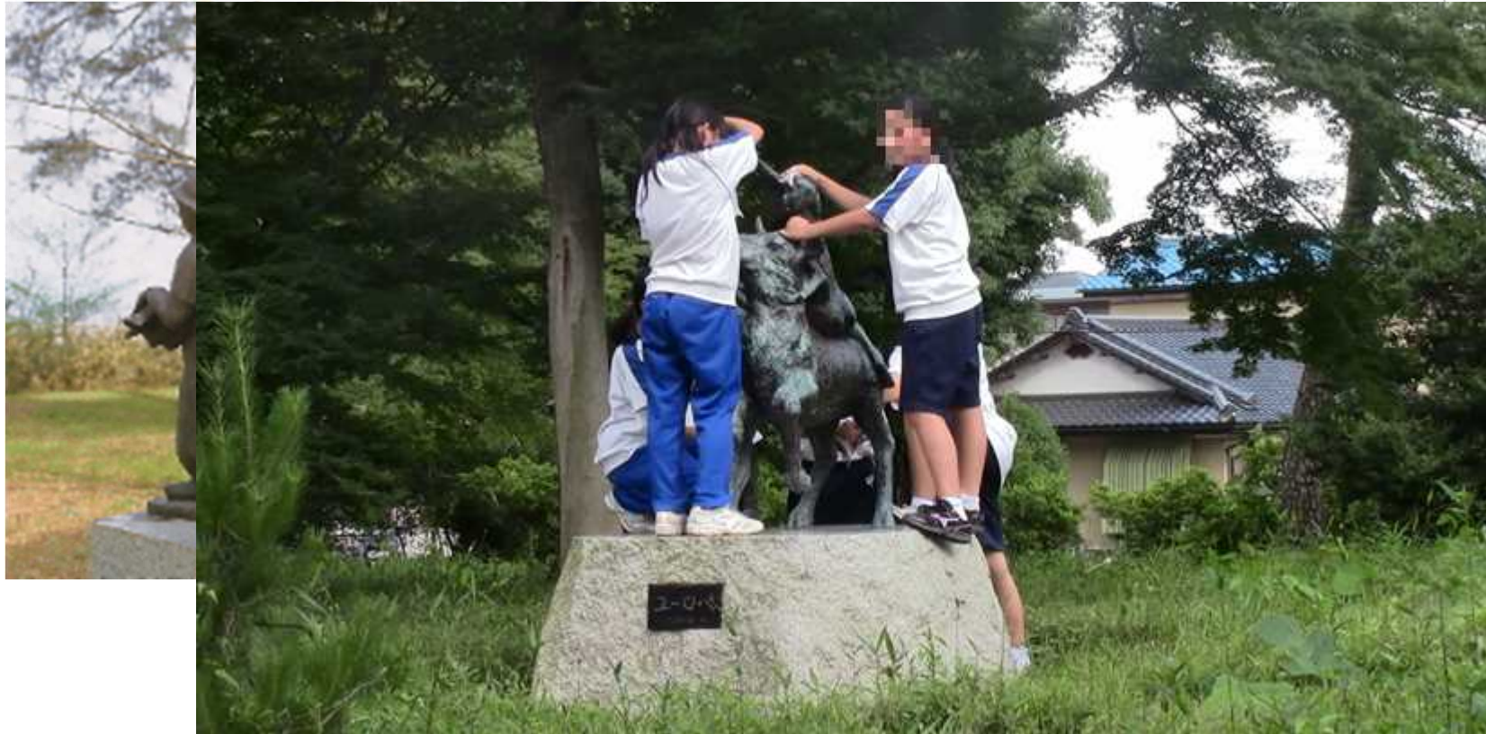
松林内と彫刻された像などの清掃作業