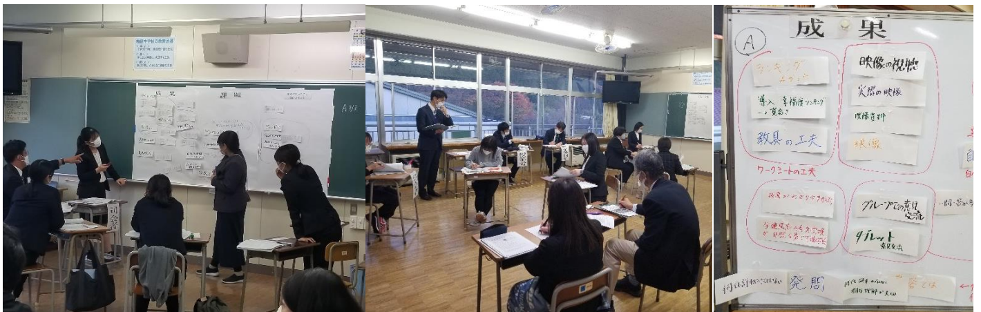
【II部:授業研究会の様子】