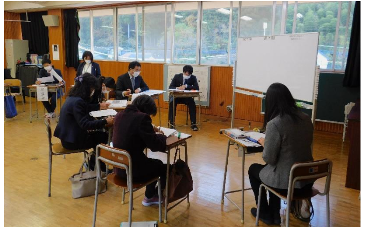
【I部:参加体験型学習の研修の様子】

II部では、授業研究会を実施しました。公開授業を基に、人権重要課題にかかわる直接的指導の在り方について、「人権教育としての授業研究の視点」を中心に協議しました。「成果」「課題」「参考になったこと、気付いたこと」について多くの御意見をいただき、活発な協議になりました。授業を公開してくださった先生方にとっても、参観された先生方にとっても、学びの多い授業研究会であったと感じました。