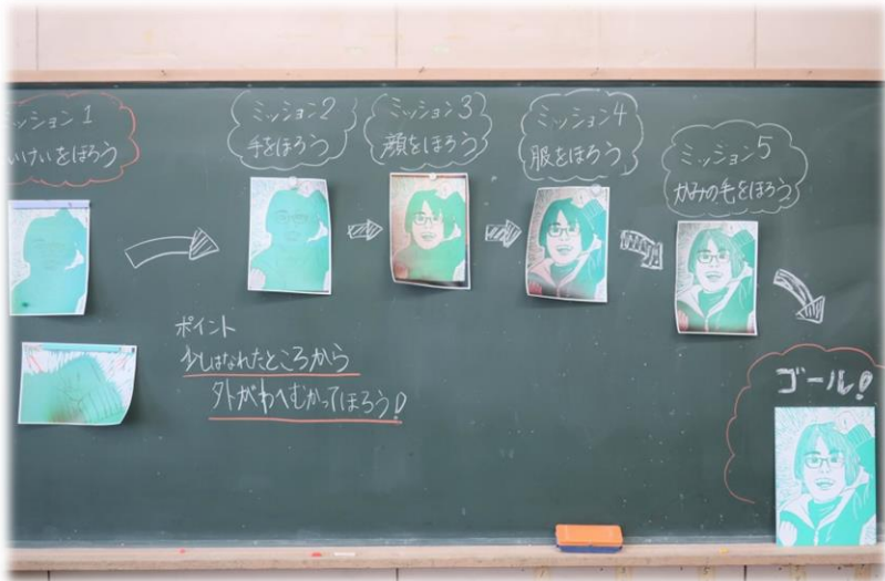
図工の版画の作業工程を図式化