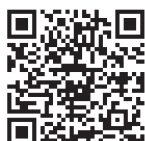
Google Play (Android用)