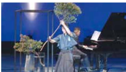
過去の公演の様子