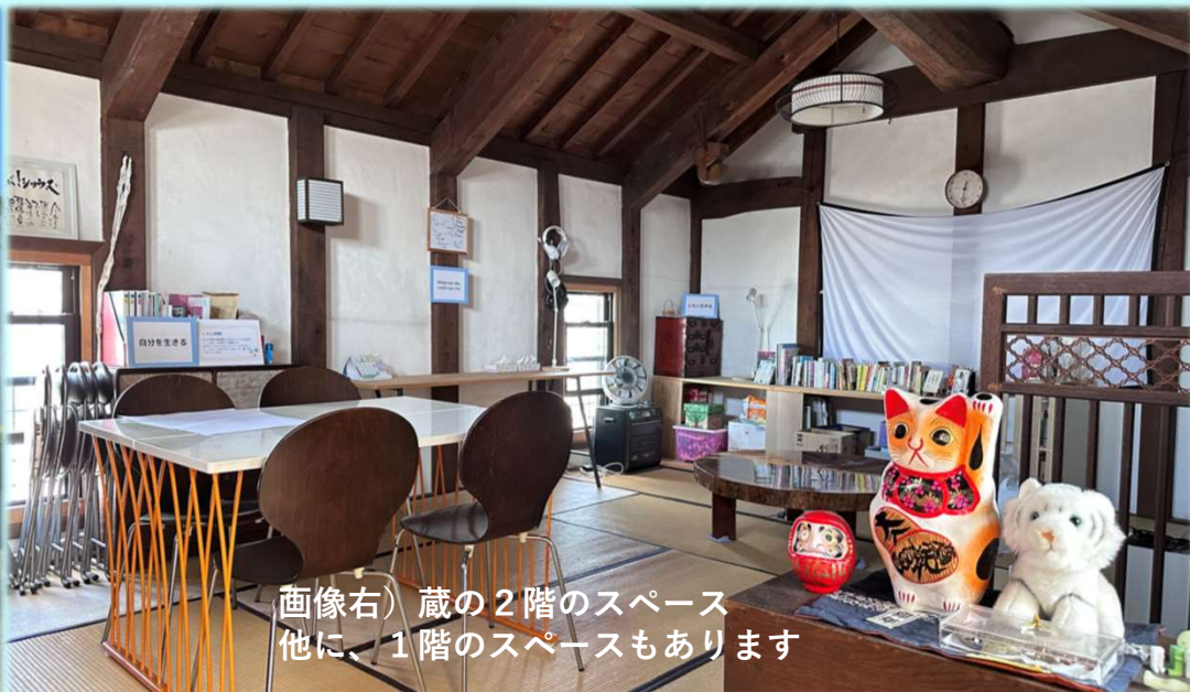
画像右) 蔵の2階のスペース他に、1階のスペースもあります