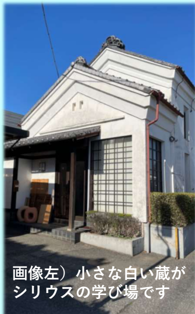
画像左) 小さな白い蔵がシリウスの学び場です