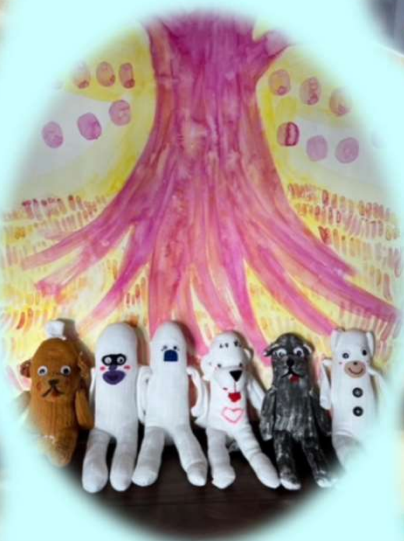
ソックモンキー作り