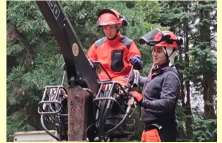
県有林における高性能林業機械操作演習