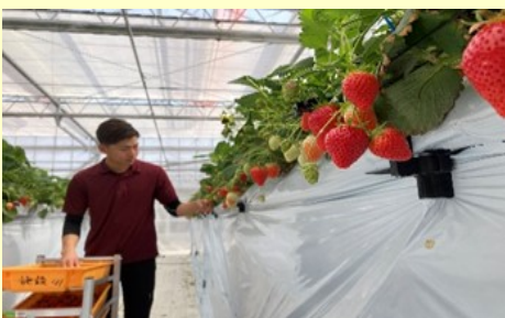
最先端技術を駆使したイノベーションファーム