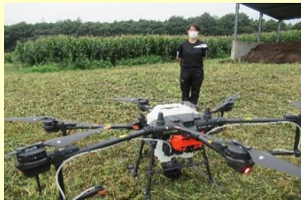
ドローンを活用した課題研究