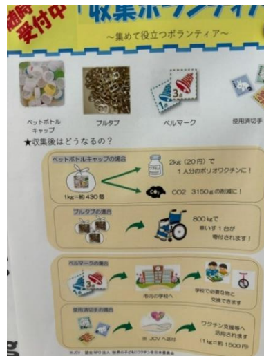
収集を呼び掛けるポスター