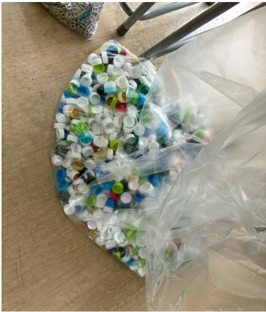
ペットボトルキャップ