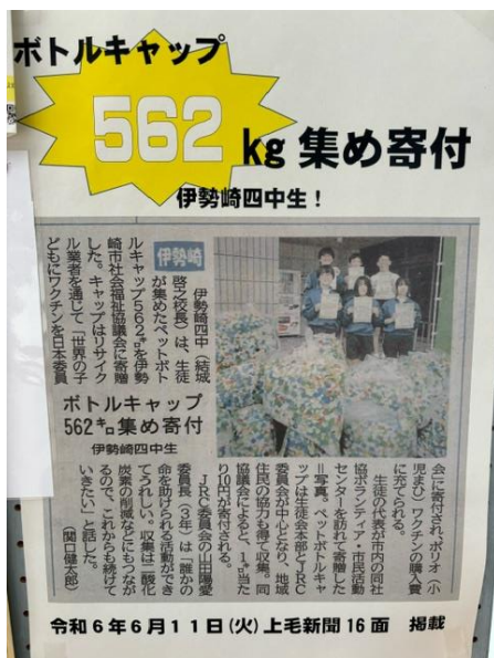
新聞掲載を知らせるポスター