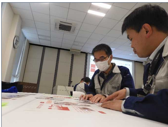
▲ターンが始まる前の作戦タイムの様子

まちづくりPLAY!では、行政、金融機関、民間企業などの地域プレイヤーとして、2030年までに地域全体の温室効果ガス排出量の半減に向けて様々なプロジェクト実施にチャレンジするシミュレーションゲームです。