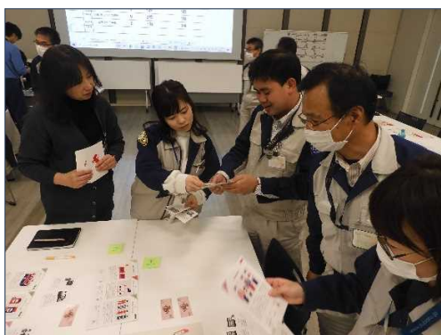
カードの交換・譲渡でプロジェクトを実施▲