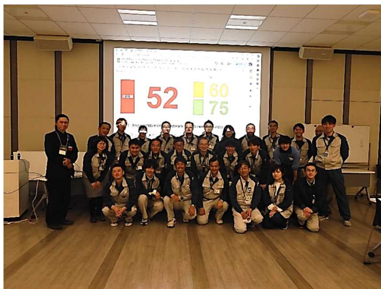
▲まちづくりPLAY!の結果を背に1枚