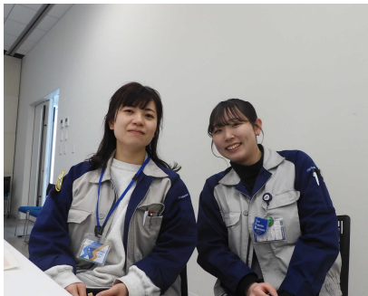
株式会社SUBARU 総務部所属