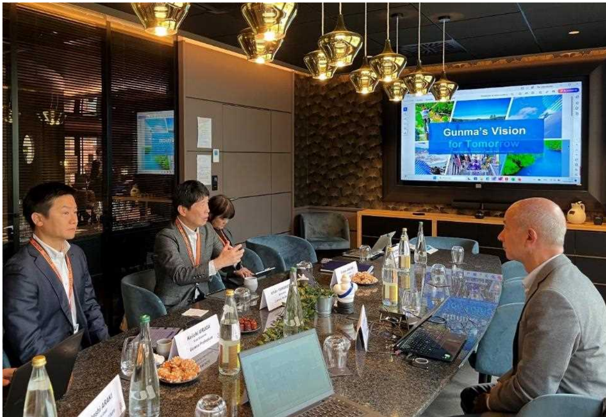
ミシュラン本社訪問