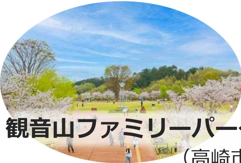
観音山ファミリーパーク (高崎市)