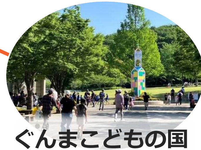
ぐんまこどもの国 (太田市)