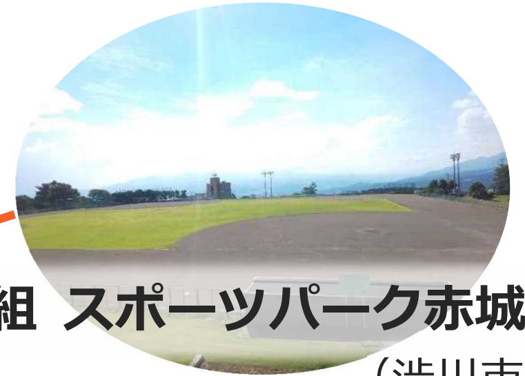
木暮組 スポーツパーク赤城 (渋川市)