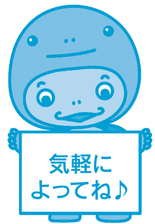
元気県ぐんまマスコットキャラクター 「GENKI(げんき)」