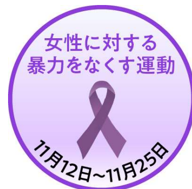
女性に対する暴力根絶のシンボル パープルリボン