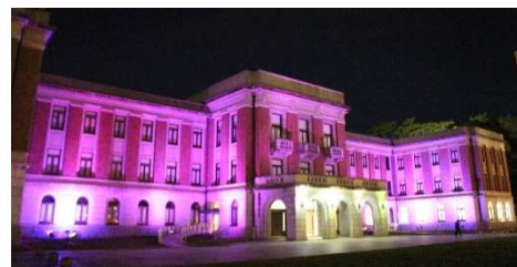
過去の昭和庁舎のパープルライトアップ