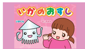
(協力：Kirakira イラスト：山口美那枝)