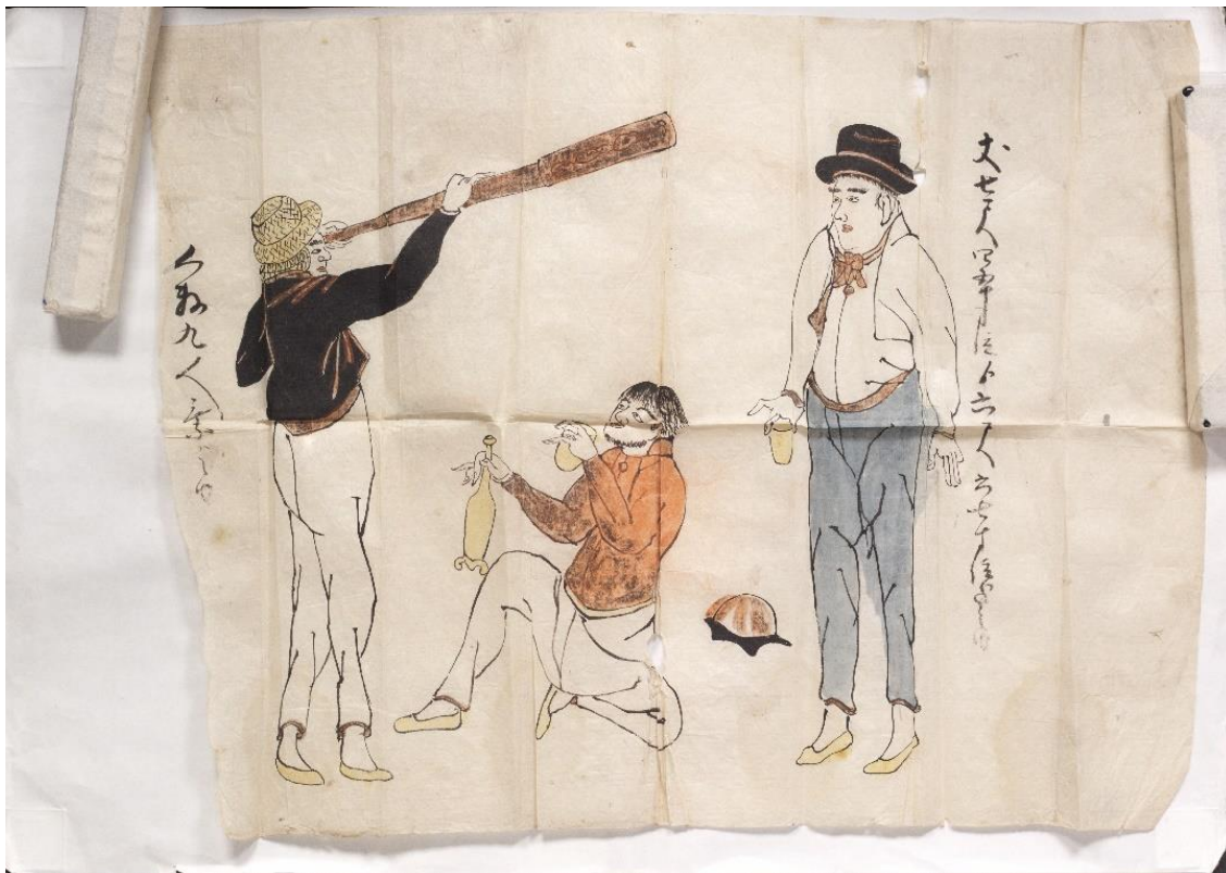
(人物3人) P1706 816-2