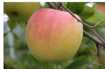
収穫期の「ぐんま名月」