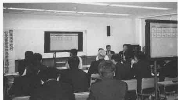
事前説明会場風景

電子化は、現在、文書が完結するまでは開発できているが、電子文書を保存するにまでは至っていない。平成3年10月1日に情報公開条例が施行されたが、今のところ、7件の開示請求があり、7件とも条例施行前に完結した文書だった。また、JR線の廃止に伴い、地域の活性基盤を整える必要性があり、庁舎内LANの整備、職員の1人1台パソコン配備、住民にも電子化によるサービスの提供を進めることになった。文書の電子化は、開示請求に耐えうる文書管理手法の実現と自治体行政情報化を視野に入れた文書管理の仕組みを構築することを目標に、既存文書の管理と電子文書化の進展の2本立てで進めてきた。