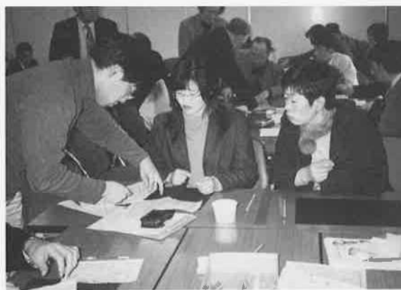
虫損の繕いをする参加者