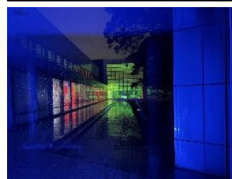
ライティングの様子