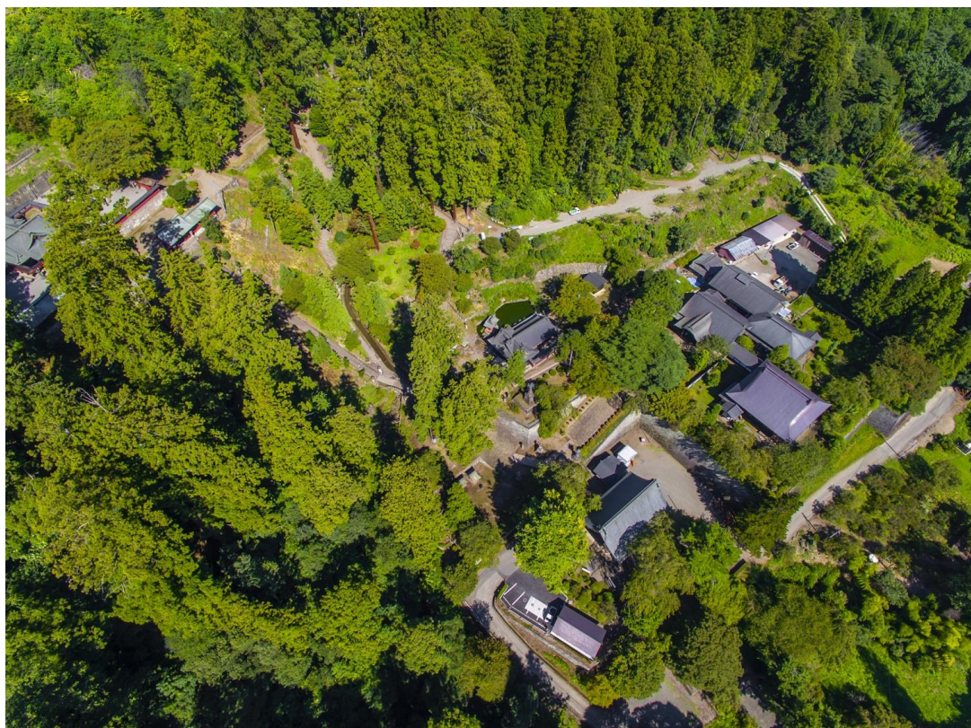
2 妙義神社 境内下段 (旧石塔寺境内)