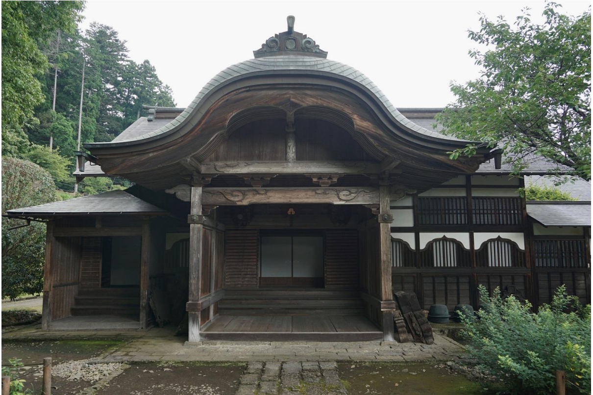
7 妙義神社 社務所 南棟玄関 南から