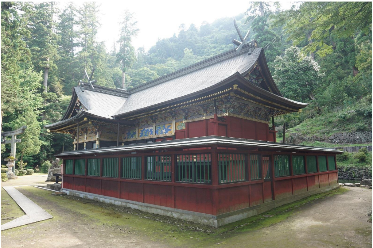
8 妙義神社 附・波己曾社本殿及び拝殿 北東から