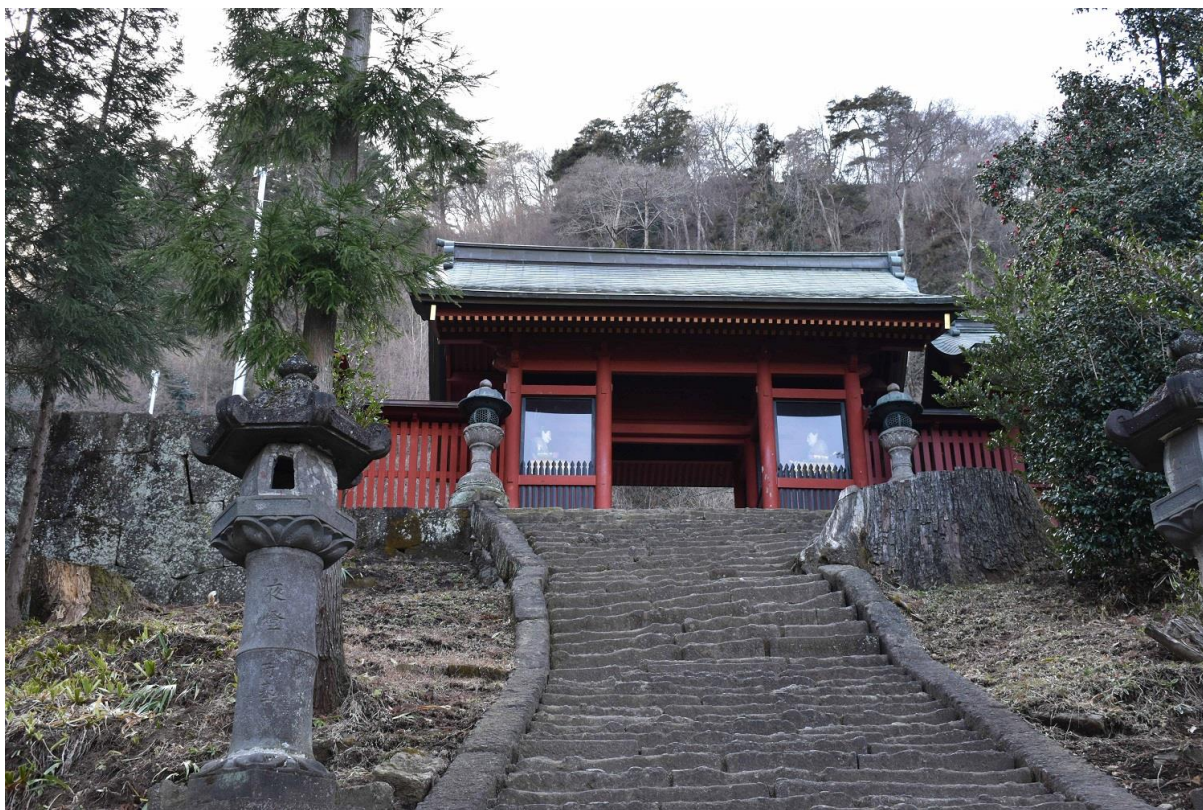
3 随神門 東から