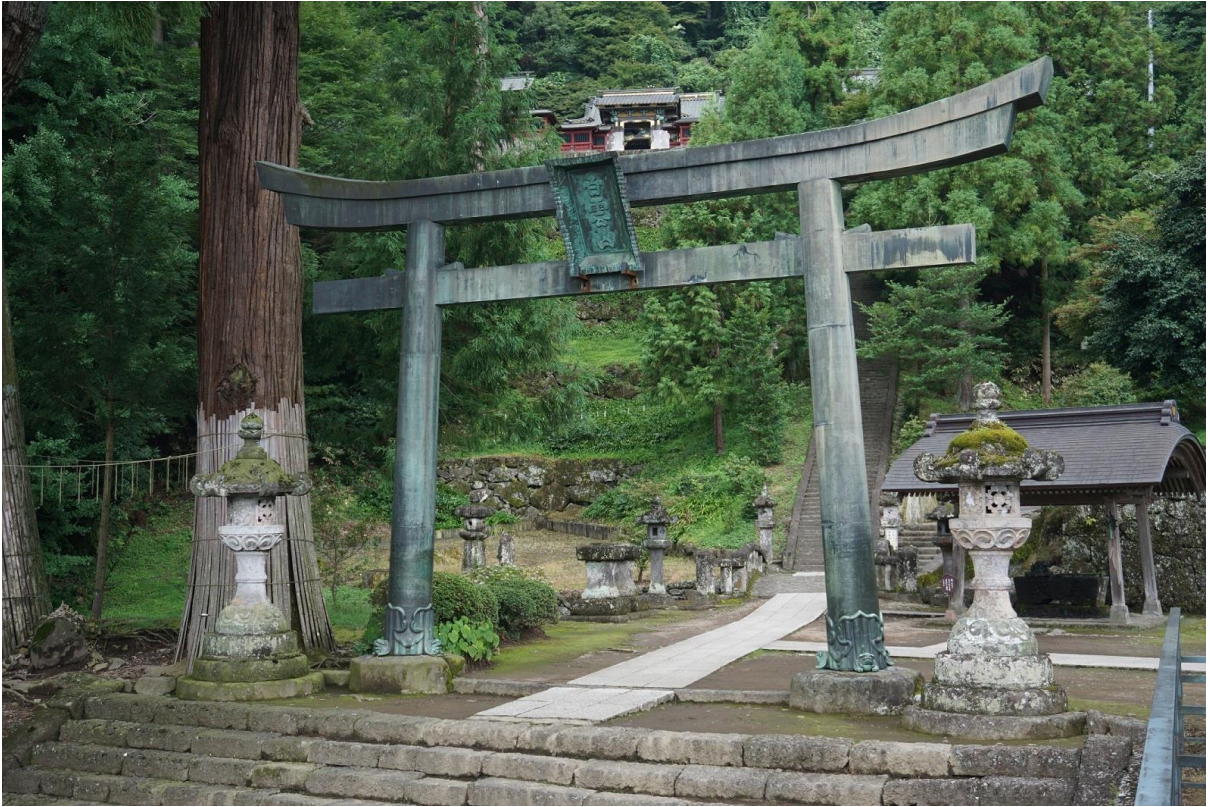
5 妙義神社 銅鳥居 東から