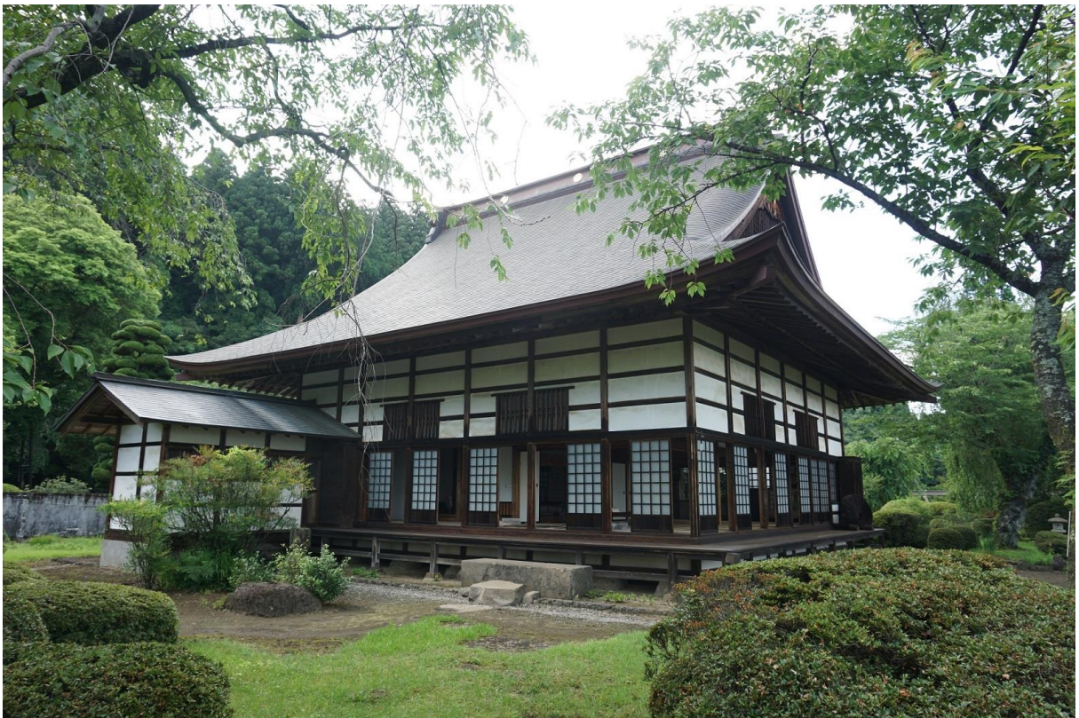
6 妙義神社 御殿 南東から