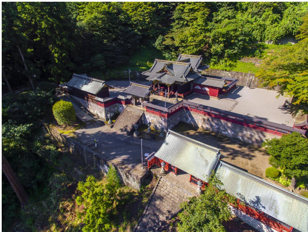
1 妙義神社 境内上段