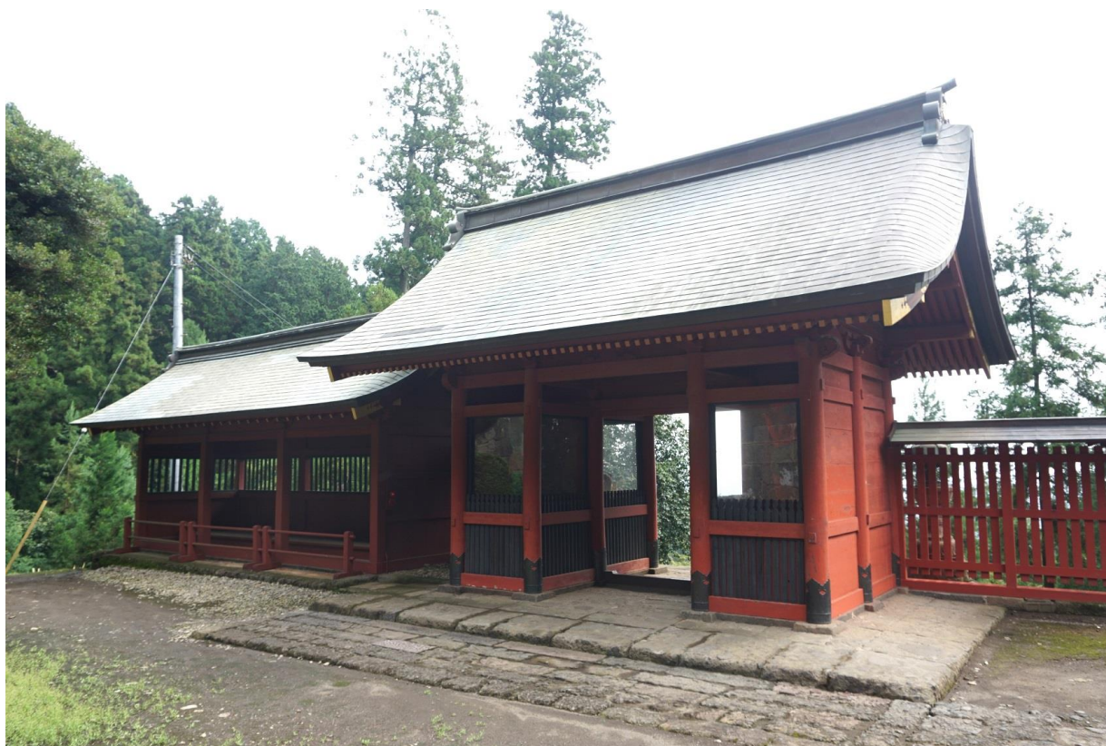
4 妙義神社 随神門・廻廊 南西から