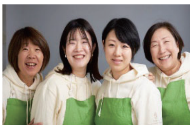
かぶしきがいしゃ むらおもひ

政策方針決定過程への参画や地域貢献活動等、様々な分野にチャレンジし輝いている女性個人・女性団体を表彰