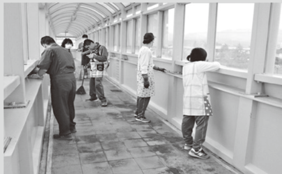
中学部1年生から3年生の14人で清掃を行っています。 いろいろな汚れがありますが、3年生が下級生に清掃の仕方を伝えながら、がんばっています。