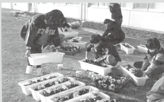
パンジーとカレンジュラを植えました。 プランターの花は、卒業式や入学式を彩ります。