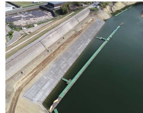
大谷牛株地区【大谷池】