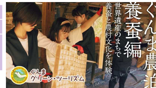
農泊モデル地区プロモーション動画「ぐんま農泊 養蚕編」