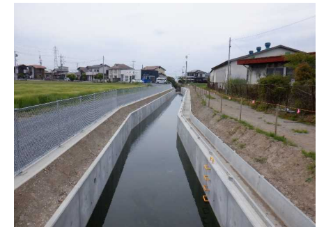
藤川用水 2 期地区