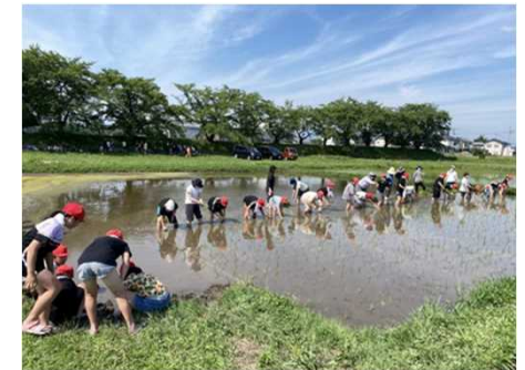
水土里ネット南新波推進協議会 【高崎市・小学生が参加した体験学習】