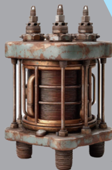
低圧コンデンサー