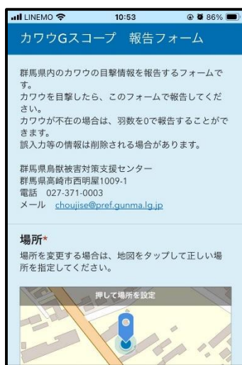
画面イメージ（報告用）

毎年繁殖し広範囲に分散するカワウの対策は、ねぐらや繁殖地、飛来箇所の把握が重要です。県では、報告された情報から、採食地の利用状況や新たな飛来箇所などを把握し、効果的な対策を実施します。