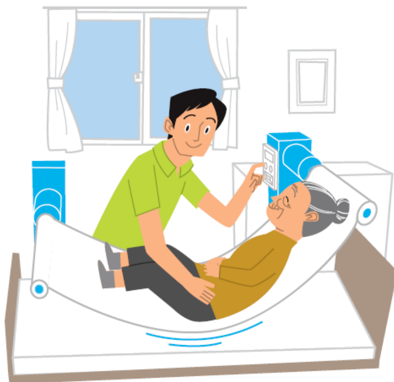
重点分野のイメージ

「ロボット介護機器開発・導入促進事業（開発補助事業）研究基本計画」 （経済産業省 製造産業局 産業機械課（平成29年10月））<抜粋>