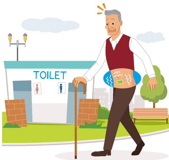
重点分野のイメージ

「ロボット介護機器開発・導入促進事業（開発補助事業）研究基本計画」 （経済産業省 製造産業局 産業機械課（平成29年10月））<抜粋>