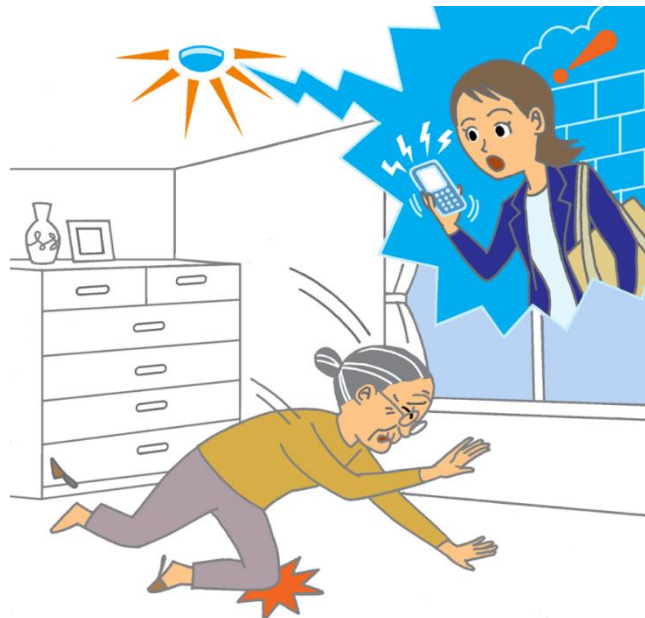
重点分野のイメージ

「ロボット介護機器開発・導入促進事業(開発補助事業)研究基本計画」 (経済産業省 製造産業局 産業機械課(平成29年10月)) <抜粋>