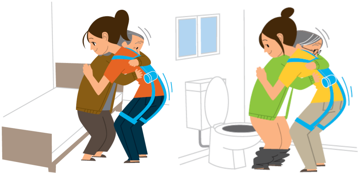
重点分野のイメージ

「ロボット介護機器開発・導入促進事業（開発補助事業）研究基本計画」 （経済産業省 製造産業局 産業機械課（平成29年10月））<抜粋>