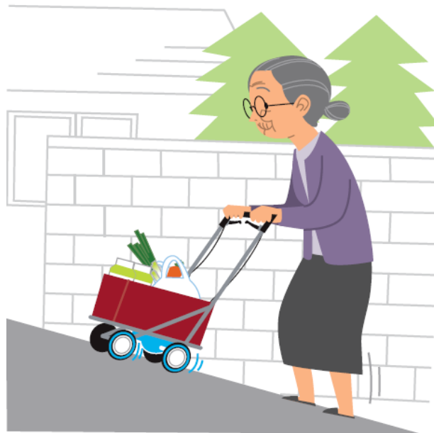
重点分野のイメージ

「ロボット介護機器開発・導入促進事業(開発補助事業)研究基本計画」 (経済産業省 製造産業局 産業機械課(平成29年10月)) <抜粋>