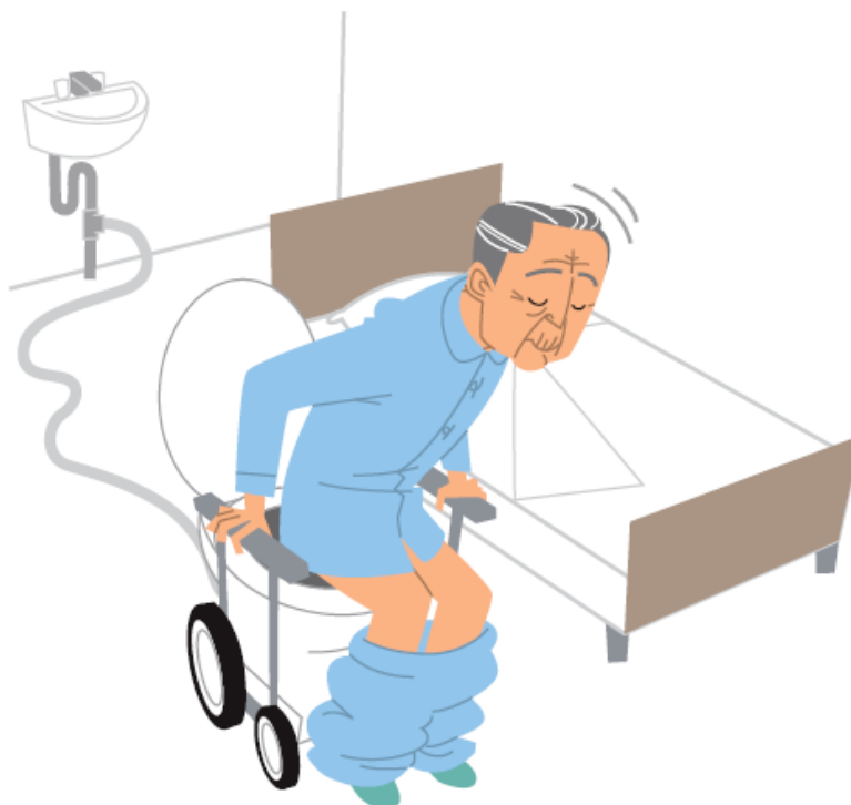
重点分野のイメージ

「ロボット介護機器開発・導入促進事業（開発補助事業）研究基本計画」 （経済産業省 製造産業局 産業機械課（平成29年10月））<抜粋>