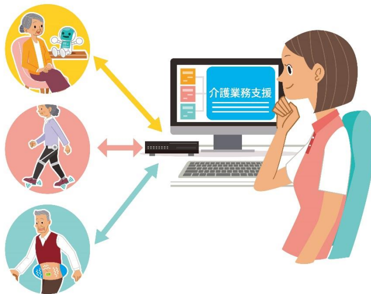
重点分野のイメージ

「ロボット介護機器開発・導入促進事業（開発補助事業）研究基本計画」 （経済産業省 製造産業局 産業機械課（平成29年10月））<抜粋>