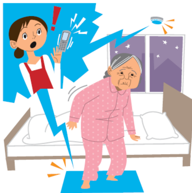
重点分野のイメージ