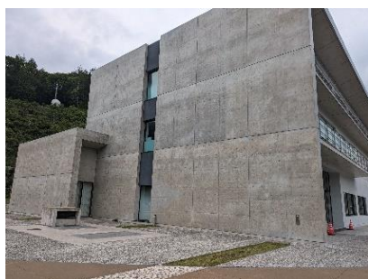
「なるほど！やんば資料館」の壁面