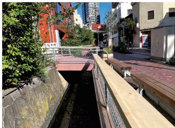
生まれ変わった馬場川

整備を牽引したのは都市再生推進法人（一社）前橋デザインコミッション（以降MDC）です。MDCは市が令和元年に策定した前橋市アーバンデザインの実現に向けた取り組みを展開しており、本プロジェクトでは説明会やワークショップの実施、社会実験を通して新たなマチの使い方を実践するなど沿道地権者や沿道事業者といった周辺の関係者を巻き込む工夫をしながら整備方針を取りまとめました。