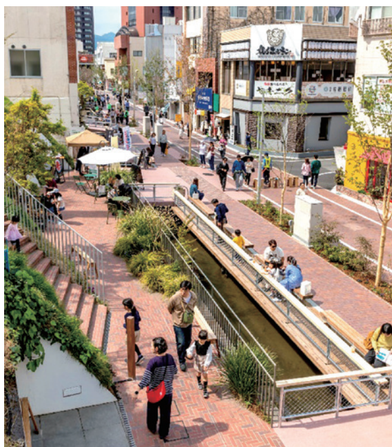
整備が完了した馬場川通り

こうした取り組みの積み重ねにより新たなまちづくり人材が生まれ、規格外の前橋産バラの販売会や、ボードゲーム大会などといった小さな取り組みが継続的に実施されるようになりました。行ってみたら「何かやっている」「新たな発見がある」そんな馬場川に訪れてみませんか。