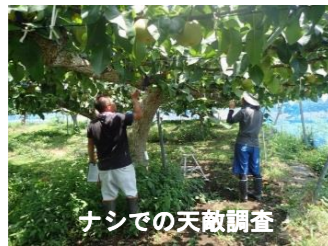
ナシでの天敵調査

農作物の病虫害に対する環境に配慮した防除技術の開発と体系化、原因不明症の原因解明とその対策について研究しています。