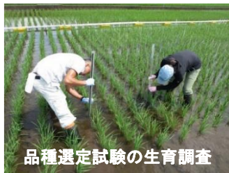
品種選定試験の生育調査

主要農作物（水稻、麦類、大豆）奨励品種の原原種・原種生産、二毛作に適した水稻・麦類の品種選定試験に取り組んでいます。