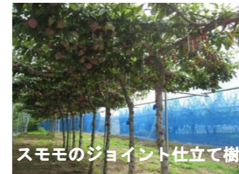
スモモのジョイント仕立て樹

ウメ・ナシ・ブドウの新品種育成の他、ナシ・モモ・スモモの新梢管理や整枝せん定法など、省力・高品質安定生産技術の研究開発に取り組んでいます。