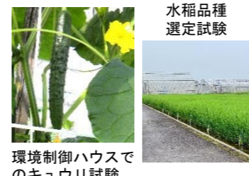
環境制御ハウスでのキュウリ試験

本県の東毛水田地帯に適応する水稻の品種選定や栽培技術に関する研究と環境制御施設等でキュウリ、ズッキーニの栽培研究を行っています。