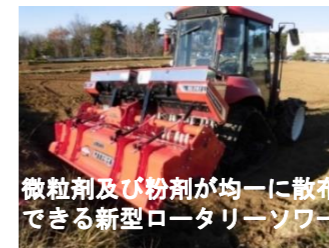
微粒剤及び粉剤が均一に散布できる新型ロータリーソーワ

キャベツ、ハクサイ、ベニバナインゲンなどの高冷地に適する野菜の栽培技術、病虫害防除法、化学肥料削減法、温暖化対策の研究を行っています。