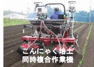
こんにゃく培土同時複合作業機

農業機械・施設の開発や効率的な利用方法について研究を行い、農作業の省力化・効率化を図ります。また、センター全体の試験研究の調整・研究成果の普及および広報などの情報発信を行っています。