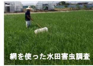
網を使った水田害虫調査

農作物の病虫害の調査データや、気象の予報などをもとに、病虫害の発生予報を毎月発表しています。また、特定の病虫害の発生が多くなると予想される場合、病虫害情報、注意報などにより、注意を呼びかけます。その他、群馬県に侵入していない病虫害の侵入警戒調査を行い、侵入が確認された場合、情報の発信及び、必要な調査を行います。