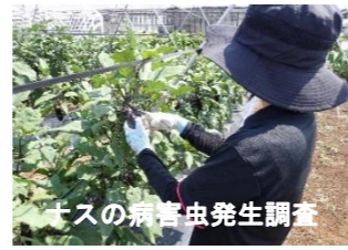
ナシの病虫害発生調査