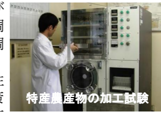
特産農産物の加工試験

農産物の成分分析及び加工技術の開発や品質調査・加工適性に関する調査研究を行っています。また、農産物の放射性物質検査および豚熱対策等に係るイノシシの検査を行っています。