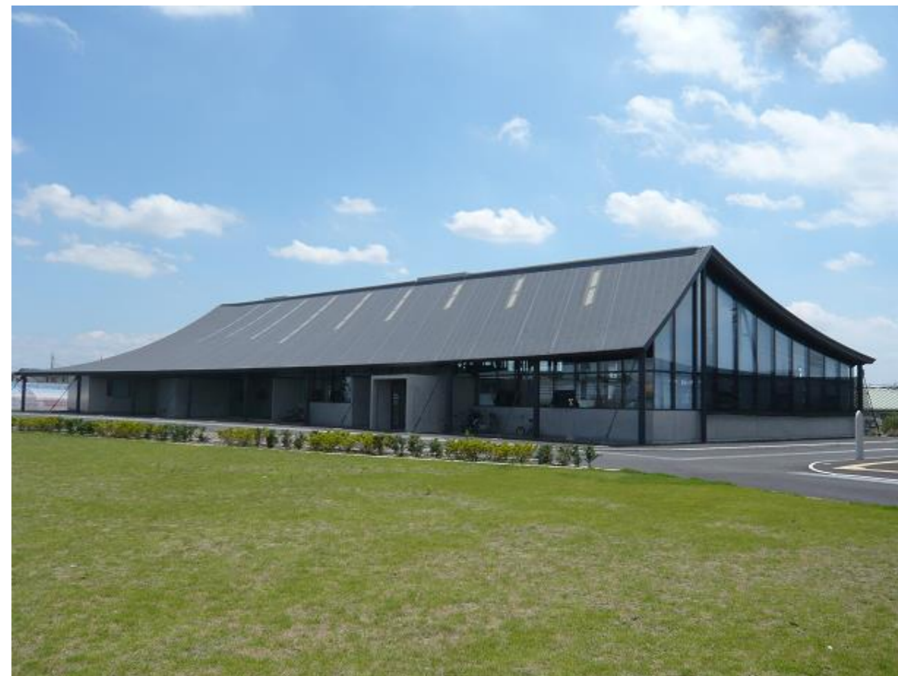
群馬県伊勢崎市 本所（本館）