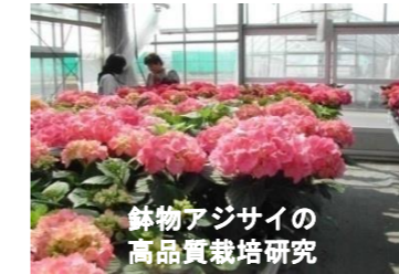
鉢物アジサイの高品質栽培研究

花き類の新品種育成、産地間競争に対応した省力・低コスト・高品質生産技術、気象変動に対応した栽培技術の開発などの研究に取り組んでいます。