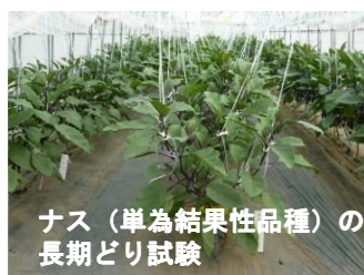
ナス（単為結果性品種）の長期どり試験

主に平坦地の野菜を中心に、環境に配慮した栽培技術、農作業環境の改善、省力的で業務用需要に対応した安定生産技術など、総合的な野菜栽培研究を行っています。