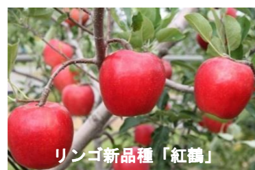
リンゴ新品種「紅鶴」

中山間地域の気象条件等にあった寒冷地果樹（リンゴ・ブルーベリー等）や地域特産野菜（トマト等）の新品種育成と安定生産技術の研究を行っています。