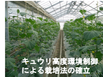
キュウリ高度環境制御による栽培法の確立

環境制御による施設野菜（キュウリ、トマト、イチゴなど）の安定生産技術の開発や、収量および品質向上に関する研究を行っています。