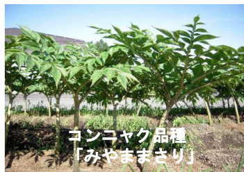
こんにゃく品種「みやまさり」

本県の特産作物であるこんにゃくの新品種育成と栽培安定化試験を中心に、タラノキの新品種育成にも取り組んでいます。