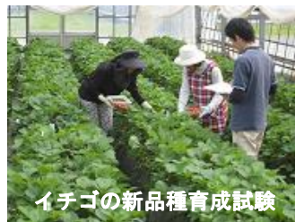
イチゴの新品種育成試験

イチゴなどの野菜について、消費者ニーズや産地の栽培条件に合った新品種の育成、およびバイオテクノロジーを活用した園芸作物の品種育成を行っています。