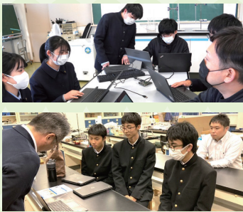
マッチング、支援の様子

群馬県在住または在学の中高生が考えた社会課題解決アイデアの発表(ピッチ)を行います。