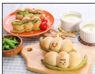
枝豆料理教室 メニュー