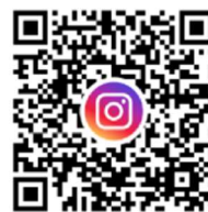
東京ガス料理教室公式

詳しくは HP をご覧ください。 https://www.tg-cooking.jp また、東京ガス料理教室公式 Instagram や 群馬県農政部公式 Instagram もご覧ください！