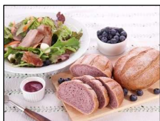
ブルーベリー料理教室 メニュー