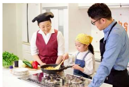
料理教室イメージ