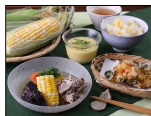
とうもろこし料理教室 メニュー