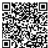
県 HP (QR コード)