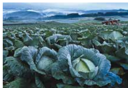
昨年度知事賞受賞の作品