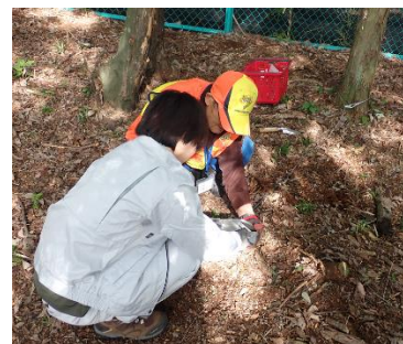
わな設置の実習の様子