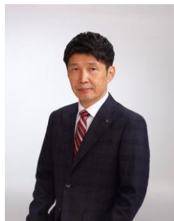
群馬県知事 山本 一太

本日は、この攻めの4年間、その先の未来に向けて、皆さんと一緒に「群馬県の未来、地域の課題」について考えていきたいと思っております。ぜひ、あなたの声を聞かせてください。