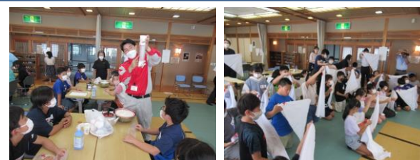
館林地区小学生青少年赤十字 トレーニングセンター実施