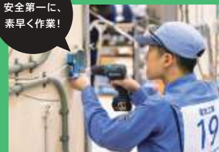
安全第一に、 素早く作業!

電気工事は、電気を生活の隅々まで送り届け、大型の機械や電灯、コンピュータにいたるまで、様々な電気設備を安全に使用できるようにする大切な技能です。1カ所でもミスをすると停電になってしまうばかりか、火災や感電事故につながることもあります。そのため、安全に確実に配線し、生活に欠かせない電気を安定して供給する必要があります。電気工事は、様々な回路や配線施工方法があるためロボット等による自動化が難しく、作業の現場では臨機応変に対応できる判断力が重要です。