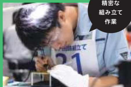
精密な 組み立て 作業

携帯電話や自動車に代表される身の回りにあるほとんどの工業製品、ロボットや宇宙船に至る最先端のシステムには、電子機器などのハードウェアが組み込まれ、それらをコントロールするソフトウェア技術が活用されています。電子回路組立て職種は、はんだ付けなどによる電子回路の組立てとマイコン制御プログラムを作成します。ハードウェア技術とソフトウェア技術が合わさったシステムを分析・試作・評価できるエンジニアの誕生が期待されています。