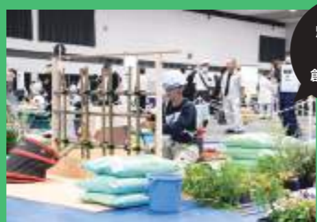
魅力的な庭を創り上げる

造園は、設計・施工・管理にいたるまで、あらゆる工程で見る人が心なごみ、自然や四季を身近に感じる景観になるよう工夫が凝らされています。そのため、樹木や石に関する深い知識、空間構成員力やデザインセンス、それらを表現するための施工技術など、多岐にわたる技能が必要です。公園緑地や街並みなどの緑化を通して、地球の温暖化防止にも貢献するなど、自然と向き合う大自然のクリエイターです。