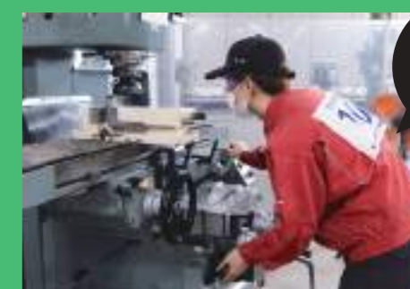
パーツを 合体させて 完成!

フライス盤は、ものづくりの現場で活躍する重要な工作機械。フライス盤による加工は、材料を前後・左右・上下に動かし、回転している切削工具で行います。フライス盤は金属の「平面加工」「溝加工」「段加工」「穴加工」などの加工が得意で、平面の組み合わせによる立体形状の機械部品を0.01mm単位の精度で加工します。機械は、1つの部品だけでは機能せず、部品の組み合わせで機能を発揮します。そのため、組み合わせる部品同士の寸法精度がとても重要となります。