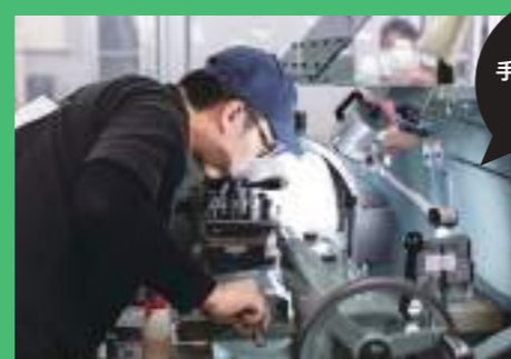
手作業による 旋盤加工

代表的な工作機械として挙げられるのが、ものづくりの立役者である「旋盤」と「フライス盤」。品物や製品には、丸い物と角形の物が組み合わされたものがたくさんあります。丸い形状の物は旋盤によって作られ、角形の形状の物はフライス盤によって作られています。旋盤を使ったものづくりは「段取り(準備)」から始まり、どのような順番でどのように加工するかを考えて、準備から完成までを何度もシミュレーションし、最高の製品を作り上げていくものです。