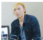
GEN 氏 CGアーティスト