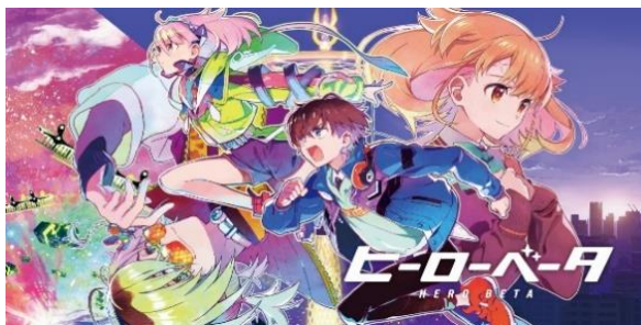
■ Live2D Creative Studio 制作アニメ「ヒーローベータ」