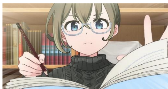
■ Live2D 公式マーケット「nizima」PV