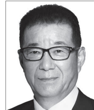
代表 松井 一郎 日本維新の会