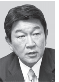
<栃木5区> もてぎ としみつ 茂木 としみつ