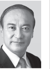
<埼玉11区> こいずみ りゅうじ 小泉 りゅうじ