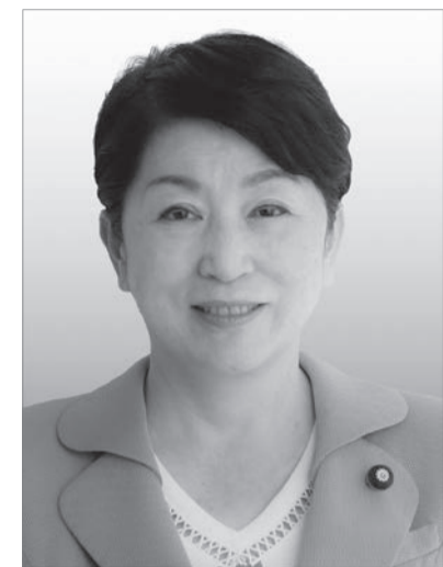
社民党党首 福島みずほ