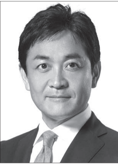
代表 玉木雄一郎 動け、日本。