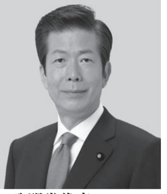
公明党代表 山口 那津男