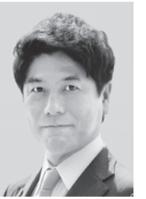
<埼玉6区> なかね かずゆき 中根 かずゆき