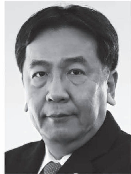
立憲民主党 代表 枝野幸男