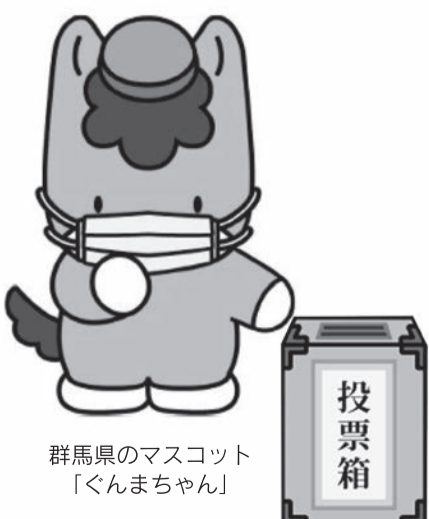
群馬県のマスコット 「くんまちゃん」