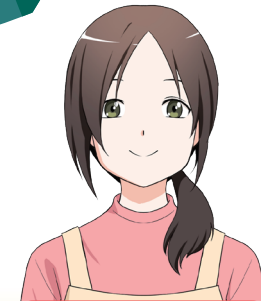
美幸の母 中山涼子 CV: 柚木 涼香