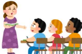
学校や 幼稚園の先生