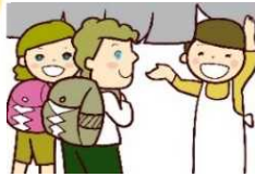
商店や 企業の経営者