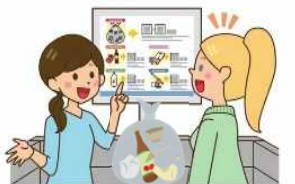
自治会や 地域を支える方