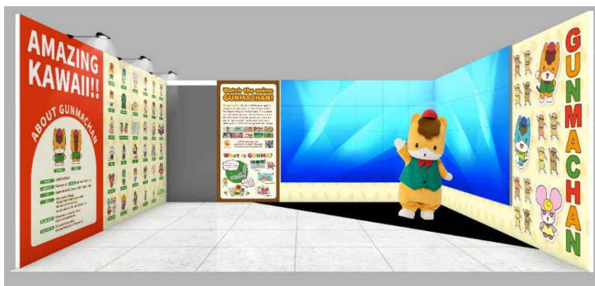
群馬県ブースB（アニメ「ぐんまちゃん」紹介、ぐんまちゃんダンスパフォーマンス等）