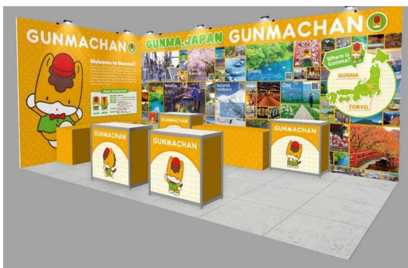
群馬県ブースA（ぐんまちゃん紹介、観光・物産PR等、ぐんまちゃんグリーティング等）