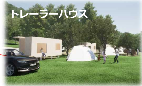
トレーラーハウス

木々の間から湖面が見えるパブリックなデッキエリアでキャンプフィールドの象徴的な存在。