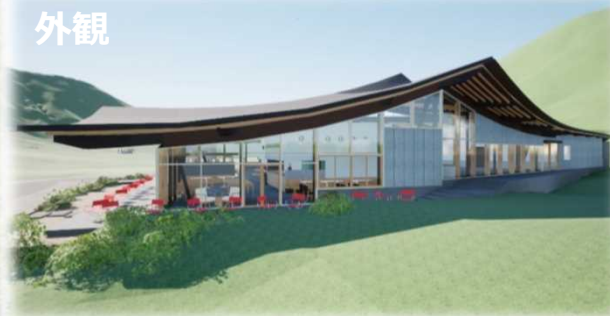
山並みに呼応するのびやかな屋根形状。 大きな庇があり、雨天時も屋外空間を利用可能。