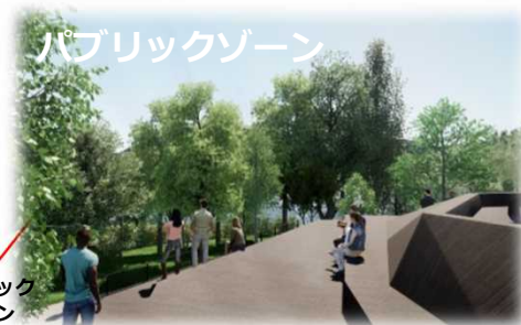
パブリックゾーン

木々の間から湖面が見えるパブリックなデッキエリアでキャンプフィールドの象徴的な存在。