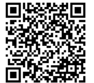
QRコードは(株)デンソーウェブの登録商標です