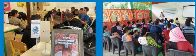
モンテネグロ：若者の参加によるワークショップ インド：家族対象の薬物乱用防止研修