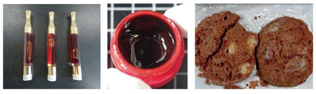
大麻リキッド 大麻ワックス 大麻クッキー

「大麻リキッド」「大麻ワックス」など大麻から幻覚成分を抽出・濃縮した加工品が摘発されています。また海外旅行のお土産としてもらったものでも違法です。