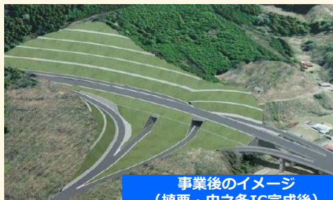
事業後のイメージ (植栗・中之条IC完成後)