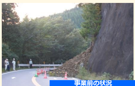
事業前の状況 (H18.10発生の斜面崩壊)