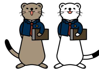
消費者被害防止啓発キャラクター 「ジョー」と「オーコ」

インターネットなどでの債務整理相談は便利な反面、相談内容を十分に伝えることが難しい場合もあります。本相談会は個別ブース・秘密厳守で面談いたしますので、是非お気軽にご利用ください。