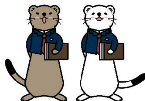
消費者被害防止啓発キャラクター 「ジョー」と「オーコ」